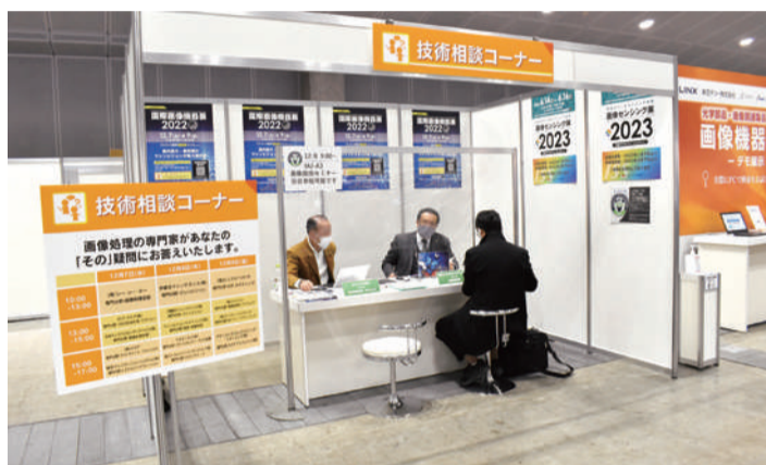
技術相談コーナーでは業界の第一人者が相談に応じる

展示会を主催して感じることの一つに、社会課題を解決できる高い技術をお持ちでも、その製品・技術を広めることに課題を抱えていらっしゃる企業の多いことが挙げられます。また業界内での横のつながりを重要と考える出展社様も多いです。そうした方々や企業がより密につながれるよう、国際画像機器展を是非ご利用いただきたいと考えます。そのため出展エリアはもちろんですが、