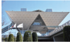
■東京ビッグサイト大規模改修工事中の利用可能な展示面積