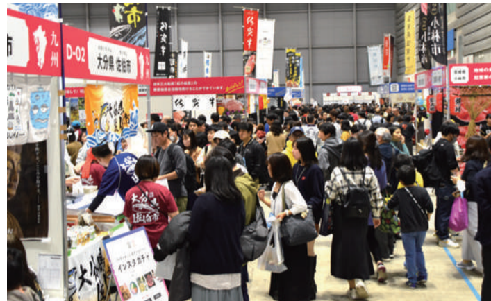
家族連れなど大勢の人が訪れた「第9回ふるさとチョイス大感謝祭」

全国約130の自治体の特産品や伝統工芸等が集まる「第9回ふるさとチョイス大感謝祭」が11月11日と12日にパシフィコ横浜で開催、1万4000人以上が来場した。