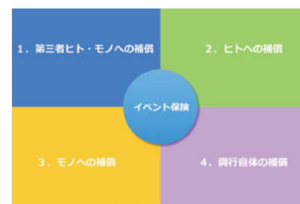
イベント保険は4種の保険の組合せ (株)ほけん biz 資料より)