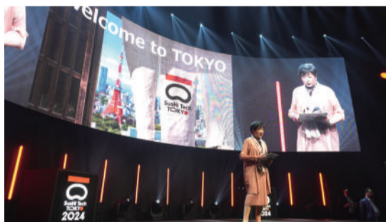
グローバルスタートアッププログラムのオープニング。英語でスピーチする小池百合子都知事

また、「SusHi Tech Tokyo 2024 グローバルスタートアッププログラム」は東京ビッグサイトで開催。「サステナブルでおもしろい都市を描き、創る」をテーマに世界共通の都市課題解決に向けた国内外スタートアップエコシステムとの「まだ見ぬ出会い」を創出するグローバルイノベーションカンファレンスとして実施された。