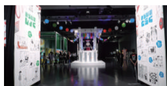
「ショーケースプログラム」(日本科学未来館会場)

ティ・リーダーズプログラム」に加え、今年是一般参加を促進する「ショーケースプログラム」も実施。有明アリーナ、日本科学未来館、シンボルプロムナード公園、海の森エリアの4