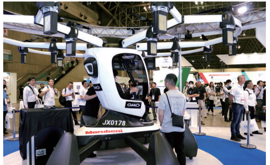
注目のeVTOL(イーブイトール)が多数展示される。